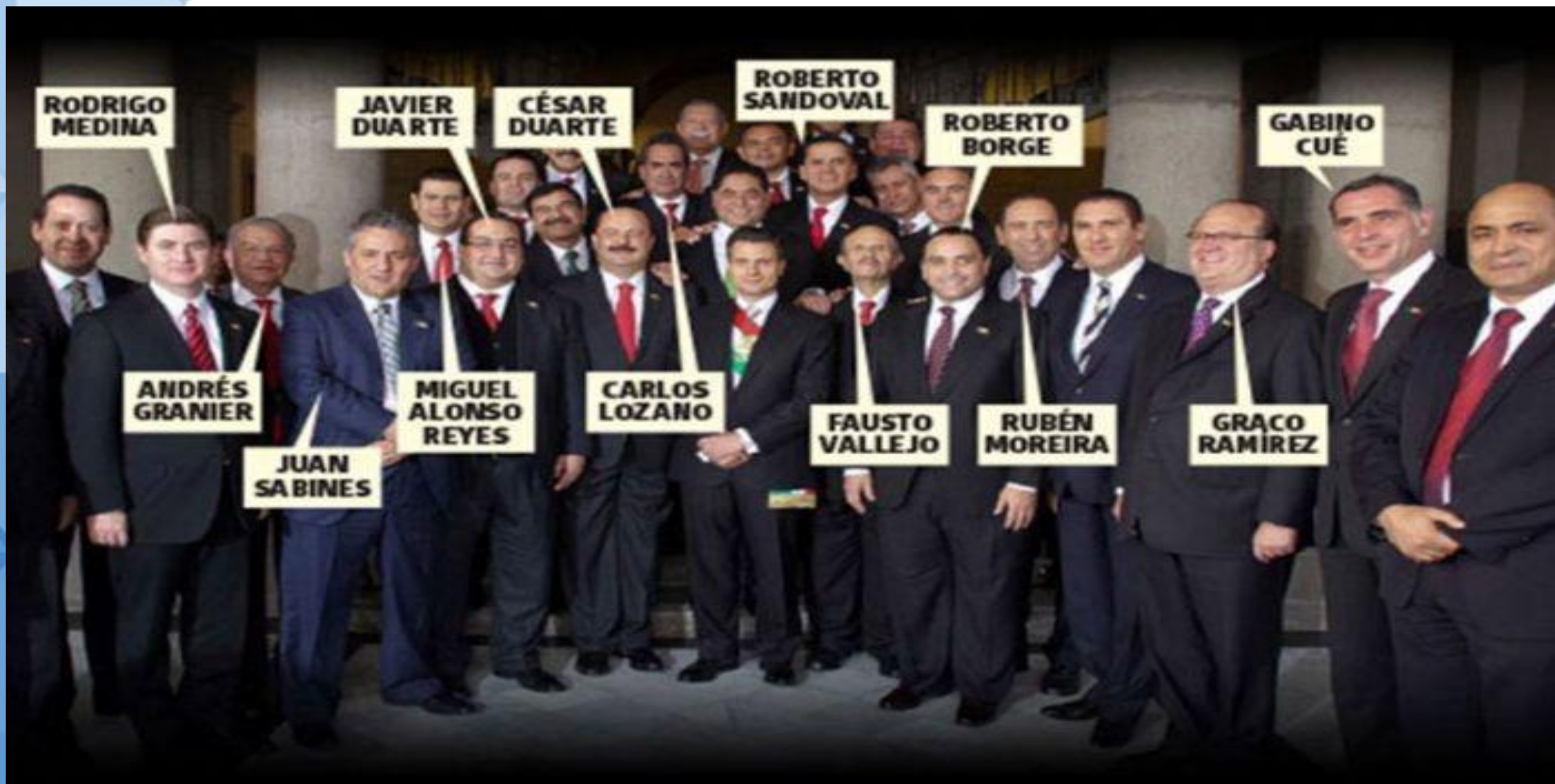
Comisión de Transparencia, Acceso a la Información Pública, Protección de Datos Personales y de Combate a la Corrupción