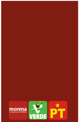
DELFINA GÓMEZ MORENA , PT, PVEM